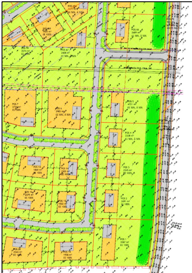
Joonis 1. Väljavõtte planeeringu põhijoonisest